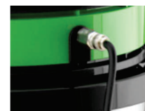
ENGATE RÁPIDO EM AÇO INOX