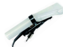
BICO PARA LAVAGEM DE ESTOFADOS ROBUSTO